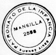
LEOPOLDO V. ONETO APODERADO

CUARTA: Los alojados ingresarán a la propiedad por el acceso situado en la intersección de la Ruta 27 y la calle Brasil, los días Lunes a partir de las 06,00 horas, y se retirarán todos los días viernes, debiendo quedar los edificios totalmente desalojados a las 16,00 horas.